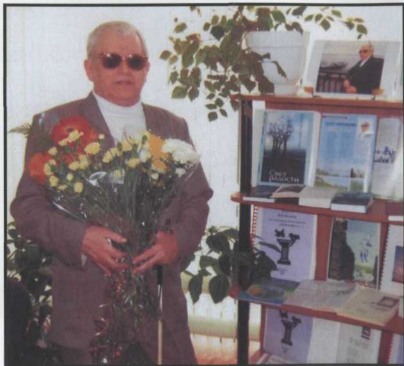
Волгоградская областная специальная библиотека для слепых 2015 г.